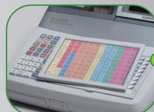
Clavier interchangeable et réversible