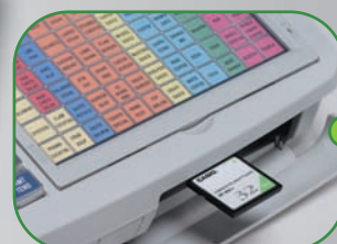
Lecteur carte Compact Flash intégré facilitant la sauvegarde/restitution des données