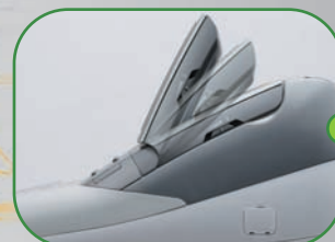
Ecran opérateur réglable