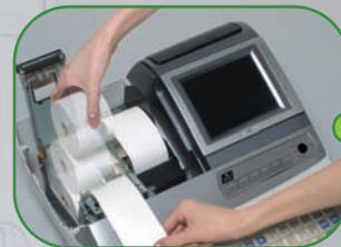
Système d'introduction papier simple et rapide