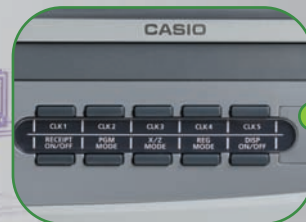
Touches multifonctions programmables