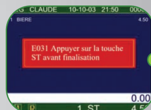
Messages d'aide à l'utilisation en couleur